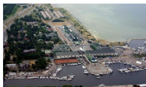
Olimpijski nautički centar (Pirita)

Zadnji put Estonija je bila domaćin Svjetskog prvenstva prije 19 godina, 1994. godine. Jedrilo se u Parnu, dok je ovog puta domaćin glavni grad, točnije JK „Kalev“, jedan od najstarijih i najuglednijih klubova u Estoniji, smješten na lijevoj obali blizu ušća rijeke Pirite. Već stoljećima, Pirita na Tallinnskom zaljevu domaćin je različitih regata, pa tako i Olimpijskih igara 1980. Klub se nalazi u sklopu Olimpijskog nautičkog centra izgrađenog upravo za te OI. Veliki kompleks uključuje i Olimpijski hotel, koji je obnovljen i preimenovan u Pirita Top Spa Hotel gdje je smješteno mnogo jedriličara (među njima i Tudor).